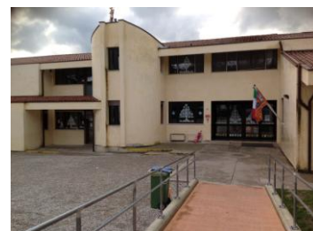
DA VINCI (GT)