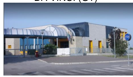
DA VINCI (DC)