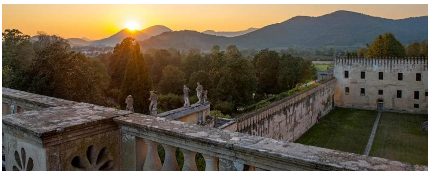
Castello del Catajo – Battaglia Terme